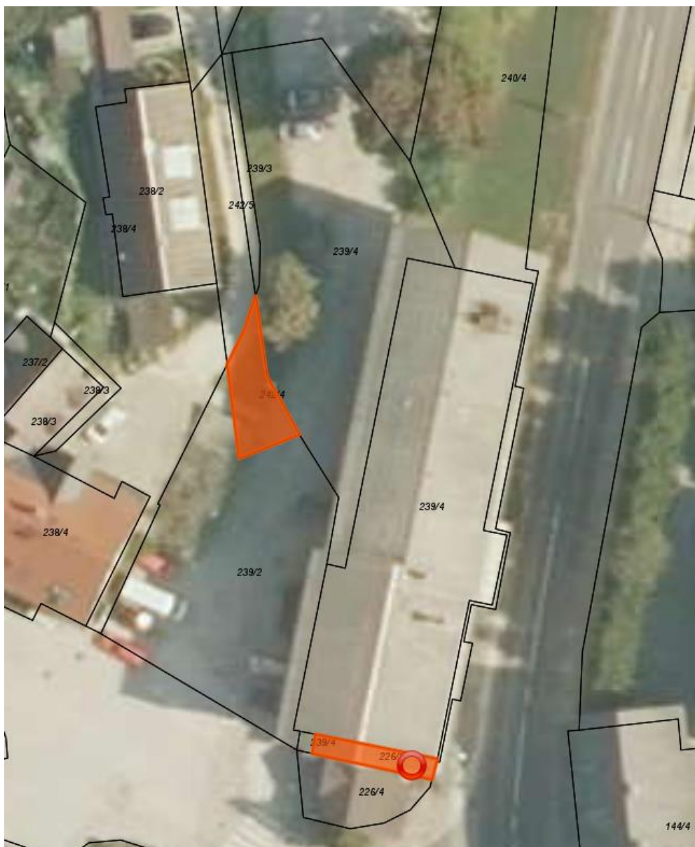
Parceli št. 242/4 in 226/3, obe k. o. 889 - Mežica