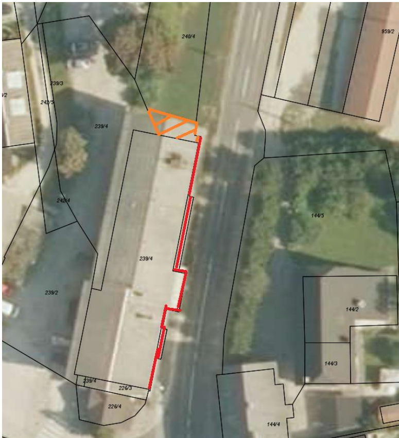
Parcela št. 240/8, k. o. Mežica – rdeča; parcela št. 240/7, k. o. Mežica - oranžno